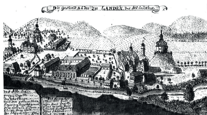
Widok Łądka-Zdroju z 1693 r.; „Barbara” w centrum ilustracji